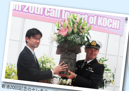
寄港20回記念のセレモニーが執り行われました!

前回寄港のクルーズ船 11月24日 日 ダイヤモンド・プリンセス & 11月27日 水 セレブリティ・ミレニアム