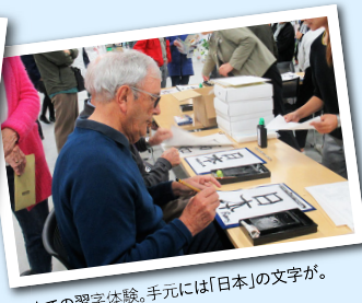
初めての習字体験。手元には「日本」の文字が。