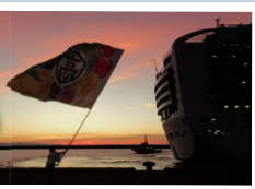
朝焼けとともに船がやってきました