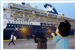
また来年度、会いましょう!

ダイヤモンド・プリンセスの高知寄港 が20回目となった記念すべき24日、ター ミナルでお祝いのセレモニーが行われ ました。それぞれの代表者の挨拶の後、 高知からは県産のユリを贈り、船からは 盾をいただきました。今年一年を通じて より一層身近になったダイヤモンド・プリ ンセス。これからもたくさんの交流がで きることを願っています。この日は他に も、紙漉きや水引づくり、習字体験、レン タサイクルコーナーが設けられました。