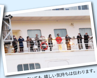
マスクをしていても、嬉しい気持ちは伝わります。