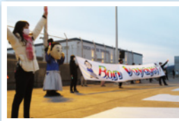
次回への楽しみを残して、出港です！