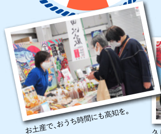
お土産で、おうち時間にも高知を。