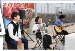
久しぶりの音色が港に響きました。