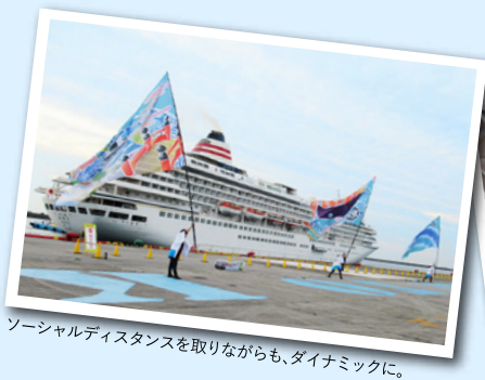
ソーシャルディスタンスを取りながらも、ダイナミックに。