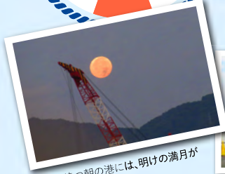
入港を待つ朝の港には、明けの満月が