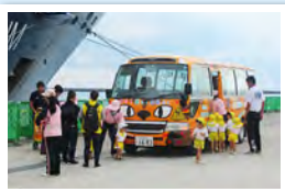
初めて見る大きな船にビックリです