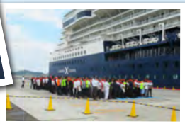
避難訓練も船旅の大切な一部