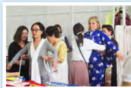
私にはどんな柄が似合うから？

だんだんと朝夕の冷え込みが強くなってきました。船は朝7時入港予定のため、スタッフたちは5時に港に集合です。港の準備が整い朝日も登った頃、セレブリティ・ミレニアムがやってきました。この日は平成学園の園児の皆さんが客船見学に来られました。生まれて初めて目にする巨大で豪華な船にビックリ。大人から見ても十分に大スケールの船体です。小さな子どもたちにとって、たいへん貴重な経験となったことでしょう。出港イベントではしまやまゆーきゃんの軽やかな音色に合わせて、ゲストシンガーの歌声が優しく乗客を見送ります。デッキからさよならを告げる大勢の人々と再会を誓い合って、夕方の空の元高知を離れる船を見送りました。