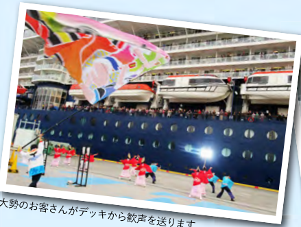
大勢のお客さんがデッキから歓声を送ります