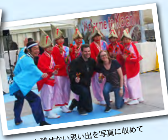
ここでしか残せない思い出を写真に収めて