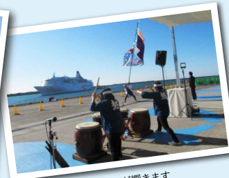
快晴の空に太鼓のリズムが響きます