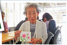
ステキな作品が出来上がってニコリ