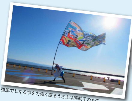
強風でしなる竿を力強く振るうさまは感動そのもの