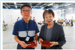
高知の締めは軽のタタキで大満足