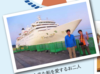
観音寺から来た船を愛するお二人