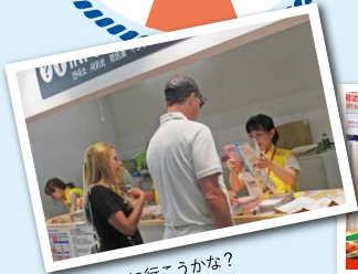
今日はどこに行こうかな?