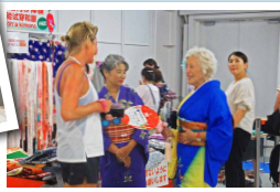
鮮やかな色彩も堂々と着こなします