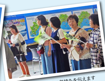
「ようこそ高知へ!」歓迎の気持ちを伝えます