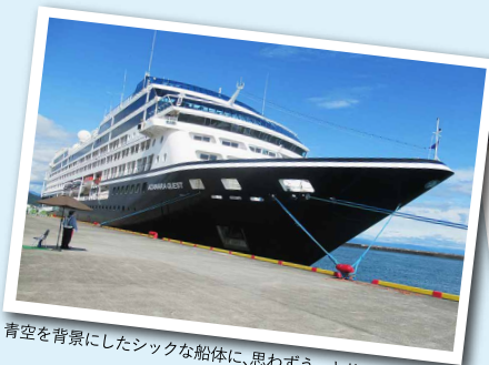
青空を背景にしたシックな船体に、思わずうっとり