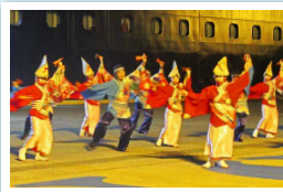
高知のリズムを思い出に