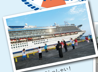
次の旅へ、いってらっしゃい！