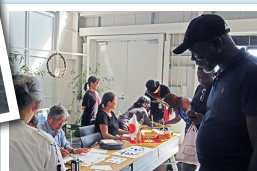
漢字を描く筆使いに興味津々