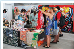
自分にぴったりのKIMONO探し