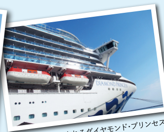
夏の日差しに照らされるダイヤモンド・プリンセス