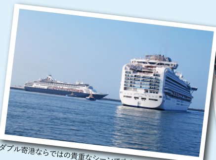
ダブル寄港ならではの貴重なシーンです！