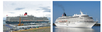
クイーン・エリザベス 飛鳥II