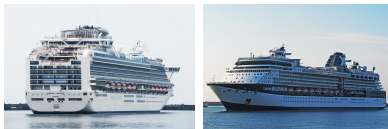
ダイヤモンド・プリンセス セレブリティ・ミレニアム