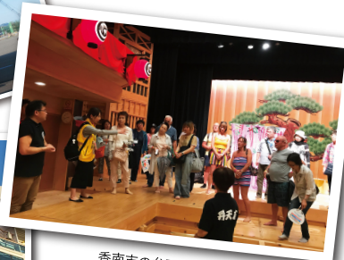
香南市の弁天座に、皆さん興味津々です