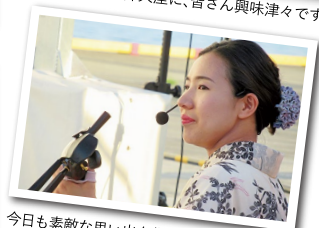
今日も素敵な思い出を作れました

翌日から梅雨入りを迎えることになったこの日、高知はたいへんな夏日になり、強い日差しの照りつける一日になりました。そんな中、港を訪れた皆さんに少しでも涼んでもらおうと今年初めて港に水蒸気散布用の扇風機が登場しました。また、今回は港にとっても高知にとっても大きな出来事がありました。高知城を始点に、土佐市と香南市への無料ツアーバスが運行されたのです。この日、香南市行きのツアーで参加者の皆さんは弁天座や手結内港を見学。土佐市は宇佐港に行きました。実用化されれば、一気に乗客の皆さんの行動範囲が広がり、高知の新しい一面を知ってもらえます。同時に、高知の皆さんにとって新しい出会いのきっかけとなることでしょう。