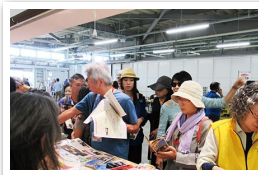
続々と訪れるお客さんに大忙し