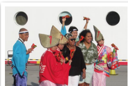
チームMINATOに囲まれてニコリ