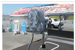
暑い港をミストで癒します