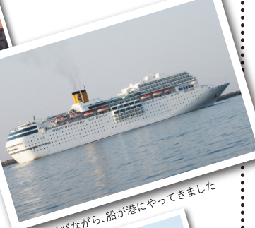
朝日を浴びながら、船が港にやってきました