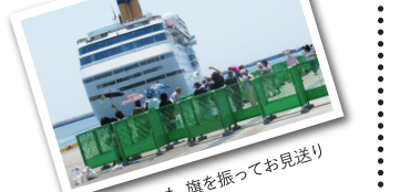
県民の皆さんも、旗を振ってお見送り

天候の影響で、20日から25日へと寄港日が変更になった「コスタ ネオロマンチカ」。この日は朝から爽やかな快晴に恵まれました。船の滞在時間は5時間程度と長くはありませんでしたが、高知は今回のクルーズの最終寄港地。乗客の皆さんは旅の終わりをめいりいっばい楽しもうと、ターミナルでショッピングを楽しんだり、中心地へ出かけたりと、それぞれが想い想いの過ごし方をしていたようです。ちなみに、ターミナル内では、名前を漢字に書き換えるコーナーが欧州からのお客さんに大好評。長蛇の列が出来ました。正午の出港時刻には、土曜の休みを利用して港にきてくれたおもてなし隊の皆さんと一緒に、よさこい踊りと音楽で、船をお見送りしました。