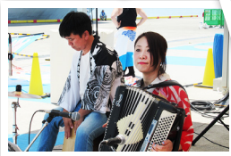
Shimayamayuの演奏が楽しく響きます