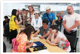
どんな漢字になるのか興味津々