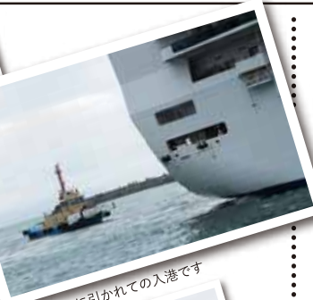
タグボートに引かれての入港です