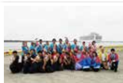
TEAM MINATOと令和の風の皆さん