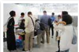
船内見学ツアーに出発です!