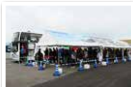
シャトルバス乗り場は大賑わい