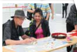
贈りたい人を思い浮かべて絵がみ作り