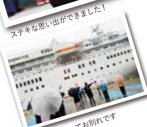
大きく手を振ってお別れです

ここしばらく曇天の多かった寄港日。この日も朝から港の空には重たい雲が横たわっていましたが、よさこい大旗には何のその。大きなはためきと山田太鼓の演奏が、はしふいっくびいなすを歓迎しました。この日はターミナル新設後の7-3岸壁にとって、初の邦船入港。外国船来航時には税関が必要ですが、今回はそのスペースがありません。そのため、イベントのための場所を取ることができ、お客さんの満足にもつながりました。時間が経つにつれ曇り空は雨空に変わりましたが、広々としたターミナルの空間を活用し、お見送りの音楽演奏やよさこい演舞も室内でお披露目。披露の時間を少し早めたことで、多くのお客さんに鑑賞していただくことができました。