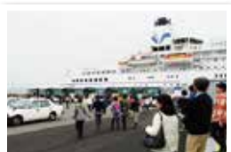
準備ができたら出発です!