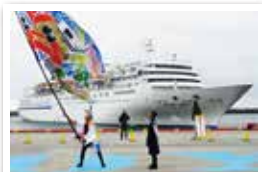
大旗がお出迎の港を彩ります