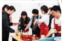
鯉のタタキの振る舞いも大盛況