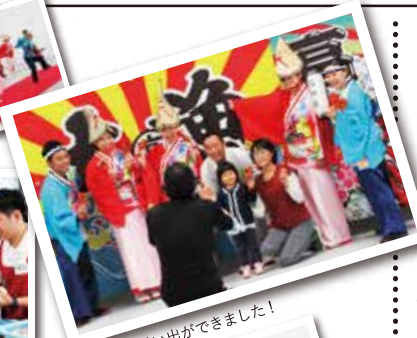
ステキな思い出ができました!