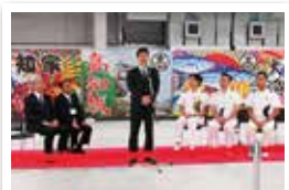
今年初入港の歓迎セレモニー